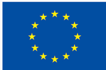
European Union in Ukraine